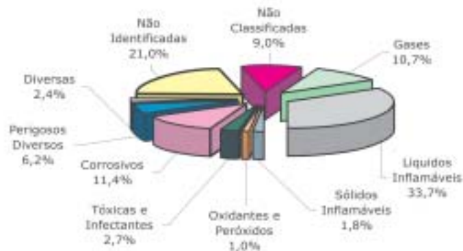
Gráfico 4 - Distribuição de acidentes ambientais por classe de risco em 2004

mulados de resposta a emergências químicas.