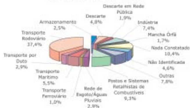
Gráfico 2 - Distribuição, por atividade, dos acidentes ambientais atendidos pela Cetesb em 2004

Observa-se ainda na Tabela 1 que a atividade que possui maior incidência de atendimentos é transporte rodoviário, fato esse que persiste desde o início das atividades da Cetesb. O número de ocorrências em postos de abastecimento vem sofrendo redução, fato esse decorrente da maior conscientização das empresas distribuidoras de combustí-