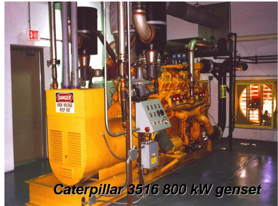
Caterpillar 3516 800 kW genset